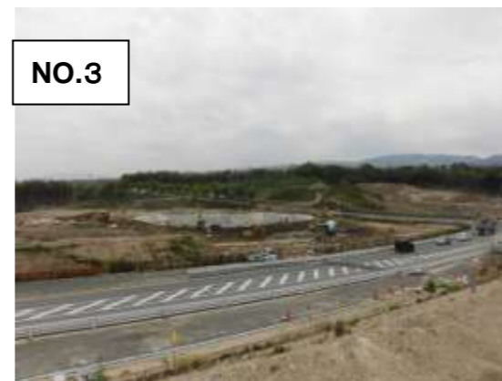
170号線付近工事状況