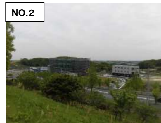
進出企業 建築工事中